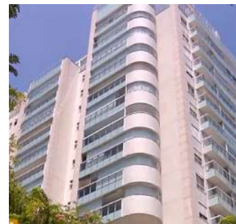
Um dos prédios do Península atingido pelos tiros

Três apartamentos do condomínio Península são alvejados por tiros