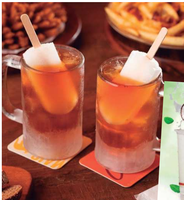
Os mates com limão do Outback e a limonada com coco

Um mix de limão e gengibre, que traz um sabor único e marcante ao chá Matte Leão. Estamos falando do Bold Lime Matte, drink não alcoólico servido no Outback por tempo limitado. Nós provamos e aprovamos a delícia no aniversário da marqueteira da Folha, Marta Corrêa, ocorrido na casa, no dia 7 de março. O drink é finalizado com um picolé de limão, deixando a experiência de se refrescar ainda