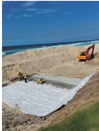
As mantas de concreto instaladas na praia pela prefeitura: desperdício