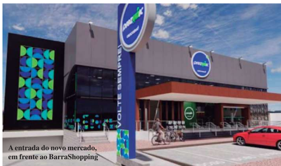
A entrada do novo mercado, em frente ao BarraShopping

Inaugurada no dia 30 de janeiro, nova unidade da rede conta até com o sistema de Fila Zero, onde o cliente escolhe a mercadoria no local, mas recebe e paga em casa