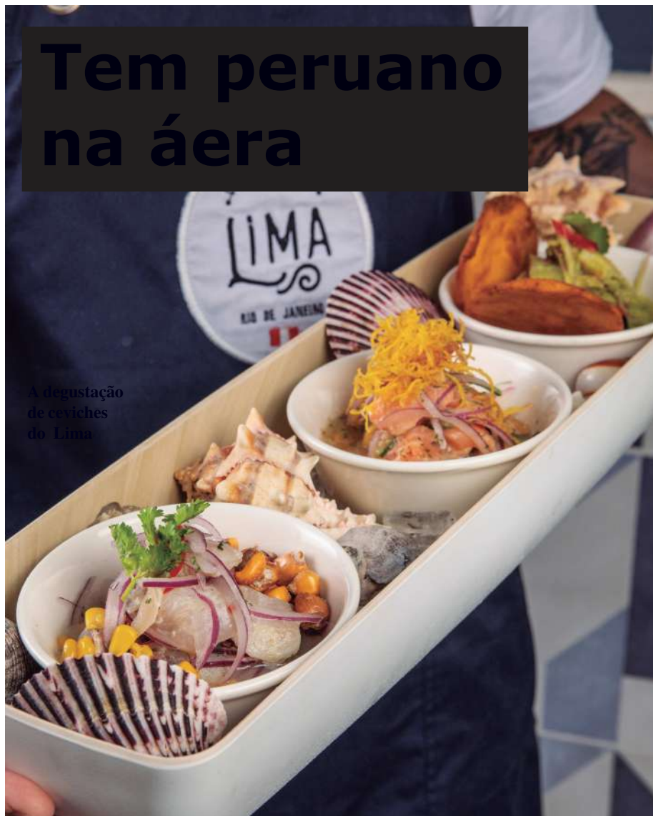
A degustação de ceviches do Lima