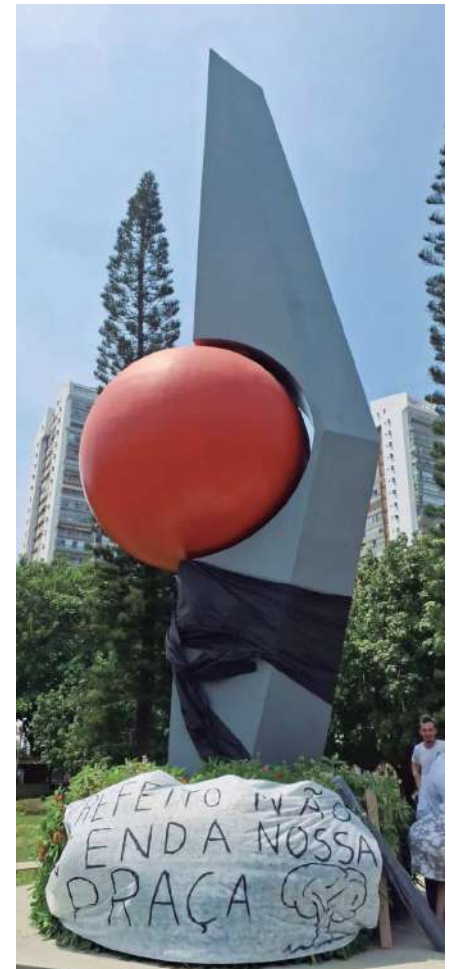
O símbolo da praça com uma faixa preta e uma outra colocada pelos moradores durante o protesto, com os dizeres: “Prefeito, não venda a nossa praça”

qualidades e o papel social da praça Gilson Amado: