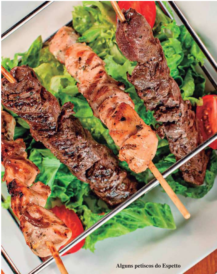
Alguns petiscos do Espetto

Rede lança cardápio especial para eventos corporativos de fim de ano. São três opções de pacotes gastronômicos