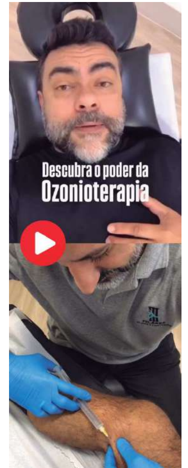
Imagens do vídeo da Folha sobre a ozonioterapia

A ozonioterapia pode ser aplicada para melhorar a circulação, a oxigenação sanguínea,