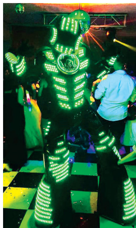
Um dos robôs animando a quarentena

Está virando rotina ir até a varanda, olhar para baixo e ver robôs gigante de led dançando nas áreas de lazer ou garagens dos condomínios. Os robôs pertencem à empresa LedRoobt, que criou o projeto Quarentena de led. A apresentação com robôs de led, mais uma fada de led e um DJ é gratuita e visa arrecadar alimentos para famílias carentes. Os moradores precisam ajudar apenas com 1 kg de alimento não perecível. Informações: 98117-1958.