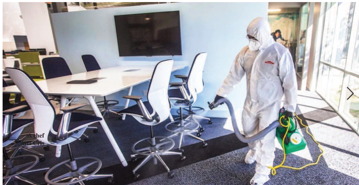
O técnico sanitiza um dos escritórios do Bosque Marapendi. Névoa protege o ambiente da proliferação de microrganismos

Objetos comuns de limpeza como vassoura, pano, detergentes e produtos